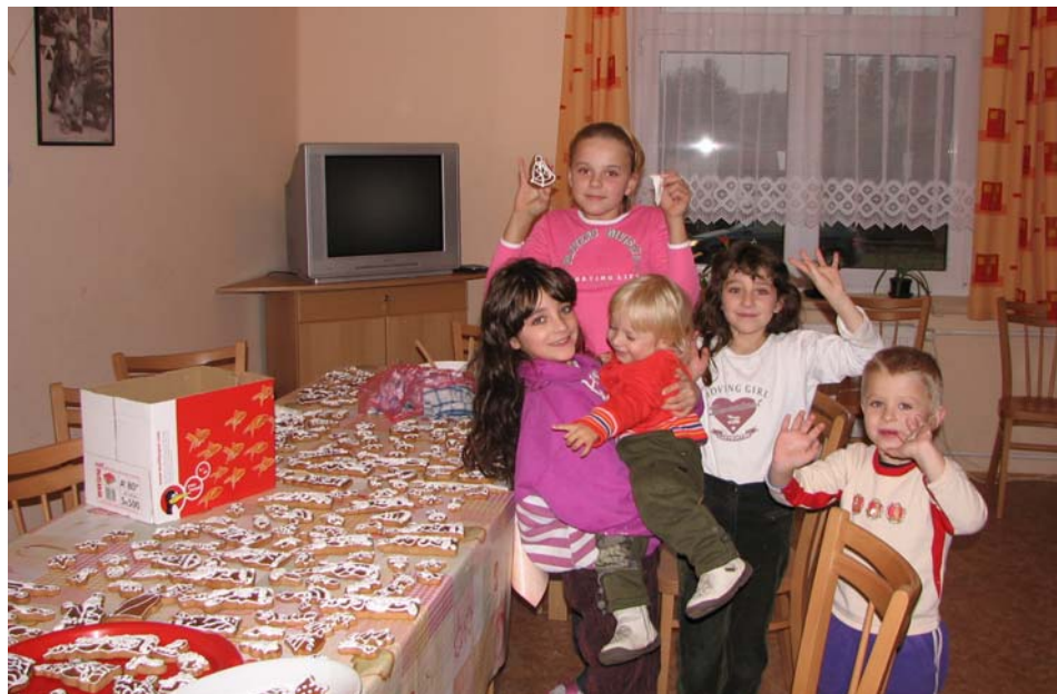
Pečení perníčků v Domově

V roce 2006 bylo v našem Domově ubytováno: