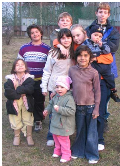
Děti z Domova