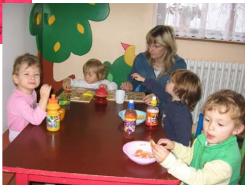
Děti v centru s hlídačící tetou