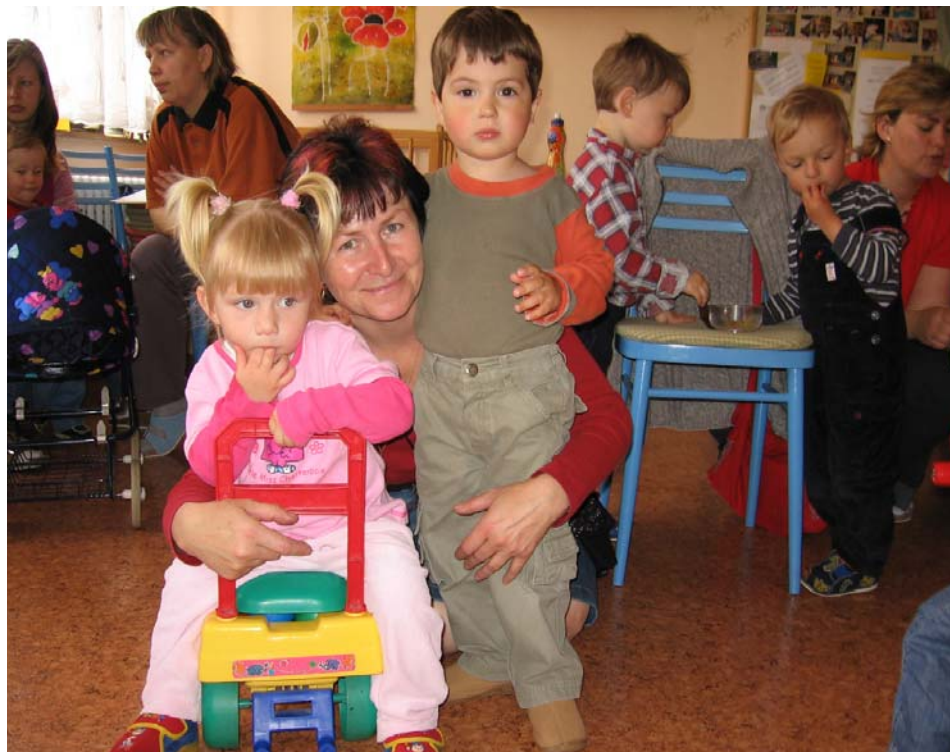
Malí zpěváci s tetou Broňou