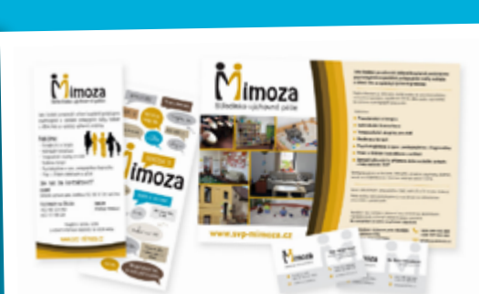
NOVÉ LOGO A TISKOVINY PRO SVP MIMOZA