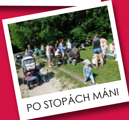
PO STOPÁCH MÁNI