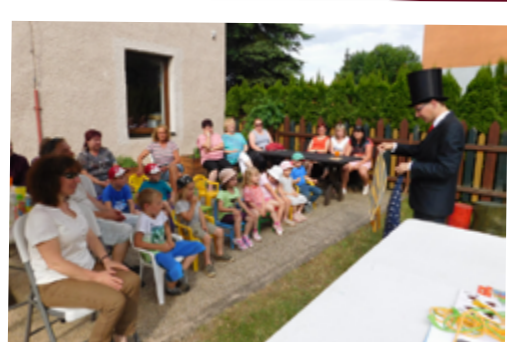
KOUZELNICKÉ ODPOLEDNE PRO PRARODIČE S VOUCATY