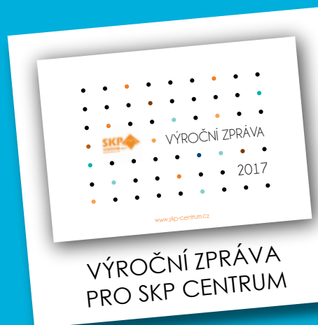
VÝROČNÍ ZPRÁVA PRO SKP CENTRUM

Ve studiu grafiky a kreativní tvorby vám nabídneme grafické služby včetně tisku až do formátu A3+. Dále je možné zde zakoupit spoustu originálních dárečků pro sebe i své blízké a během nákupu Vám rádi nabídneme výbornou kávu. Najdete nás v 1. patře Rodinného centra, Nádražní 22, Žamberk. Více informací naleznete na našich webových stránkách.