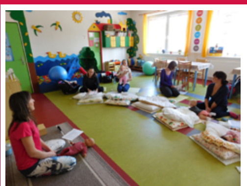
KURZ MASÁŽE KOJENCŮ