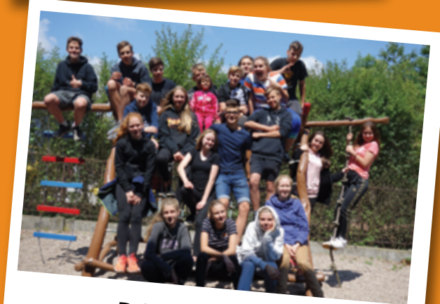
DOBROVOLNÍCI Z GYMNÁZIA DUHOVKA PRAHA