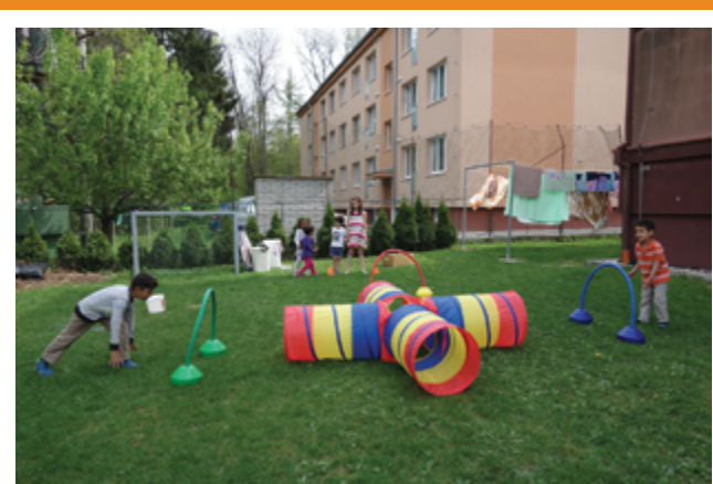
SPORTOVNÍ HRY NA ZAHRADĚ