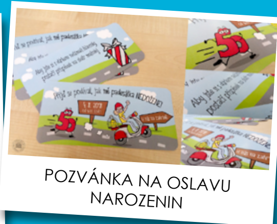
POZVÁNKA NA OSLAVU NAROZENIN