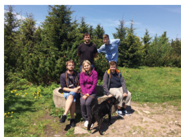
ZÁTĚŽOVÝ TERAPEUTICKÝ PROGRAM PRO UŽIVATELE - VELKÁ DEŠTNÁ