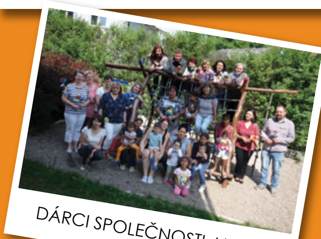
DÁRCI SPOLEČNOSTI ALBERT